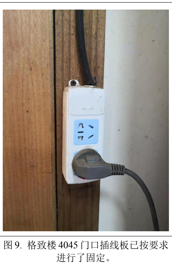
图 9. 格致楼 4045 门口插线板已按要求进行了固定。