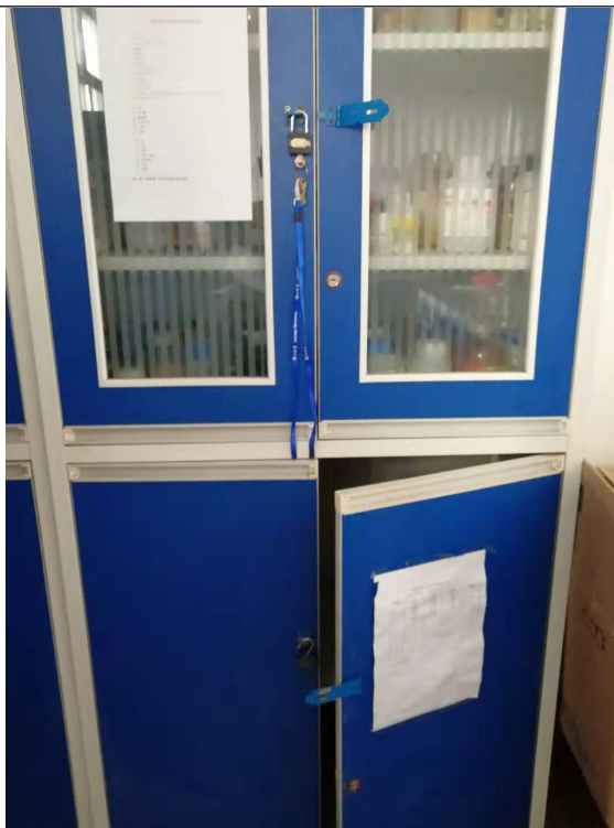
图 1. 格致楼 2043-2 易制毒药品柜未上锁柜门敞开，无药品使用记录。