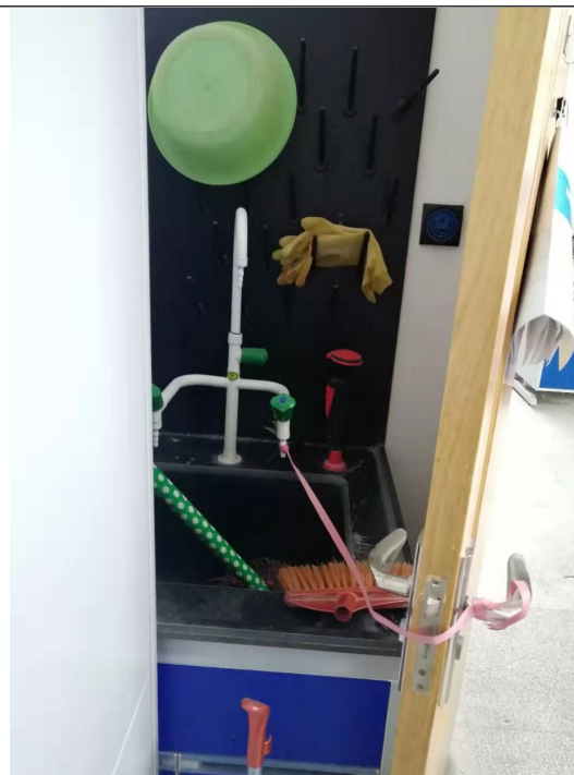
图 2. 格致楼 2043-2 套间房门用绳子拴在水龙头上，存在问题。