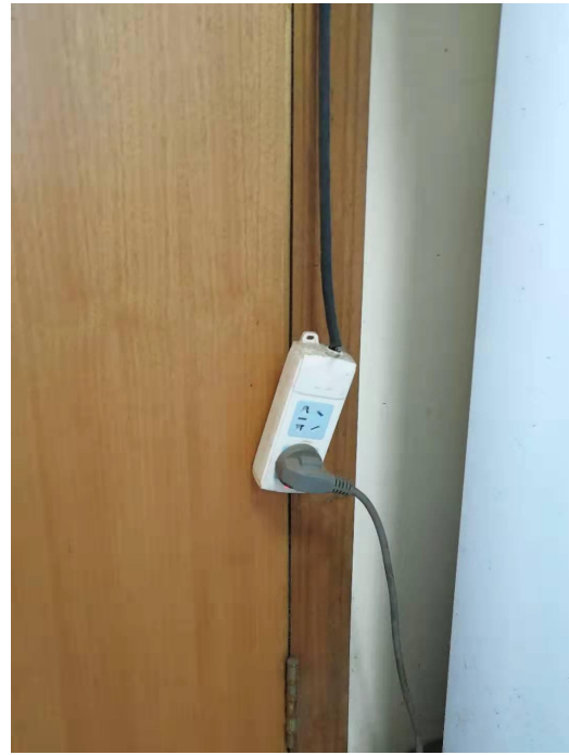
图 6. 格致楼 4045 门口插线板未固定。