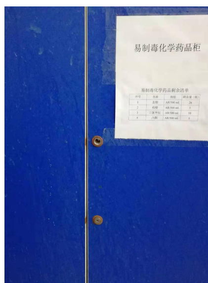
图 4. 格致楼 3033 易制毒药品柜单锁管理（一把锁损坏，未修理）。