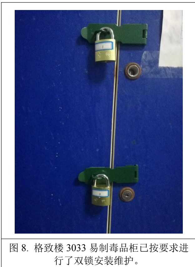
图 8. 格致楼 3033 易制毒品柜已按要求进行了双锁安装维护。