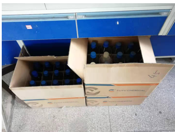
图 3. 格致楼 2043-2 两箱试剂空瓶从上学期检查到现在仍未处理。