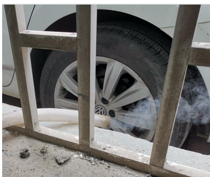
格致楼 1015：① 实验设备后，靠墙地面上尘土过多、不整洁；② 5月29日下午复查，发现真空设备的机械泵排气管冒出大量烟雾（出口在室外），存在明显安全隐患。