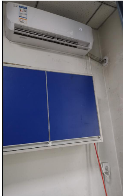
格致楼 1005：空调用电安全隐患已整改。