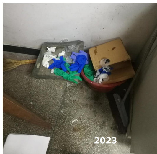
格致楼 2023：易燃垃圾多、清理不及时。