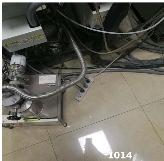
格致楼 1014：插线板直接放置在地面。